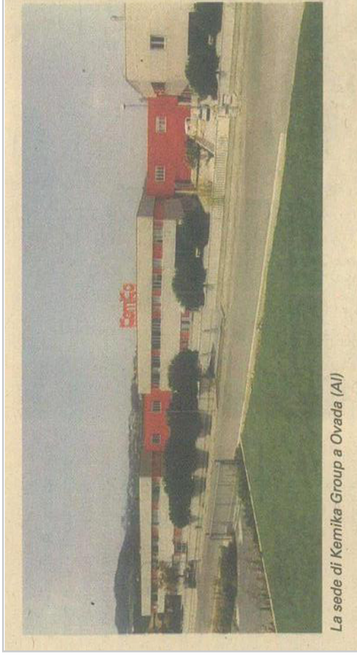
La sede di Kemika Group a Ovada (AI)